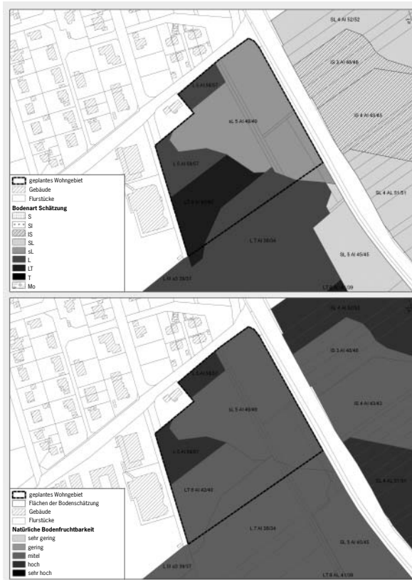
Abb. 2: Datengrundlage und Bewertung der Bodenteilfunktion „Natürliche Bodenfruchtbarkeit“ im Fallbeispiel 2